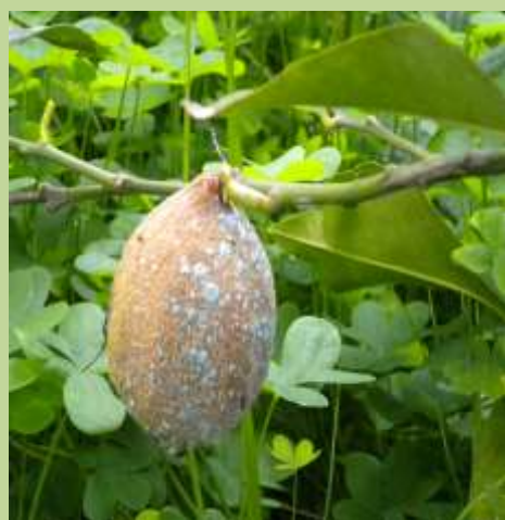
Allupatura ( Phytophora spp )