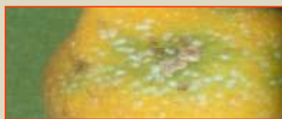
Cocciniglia bianca del limone

In presenza di focolai di ragnetto ( Tetranychus urticae ), si consiglia di intervenire con olio bianco (1 kg per ql di acqua) attivato con un acaricida ovo-larvicida e un acaricida larva-adulticida, di quelli sopra menzionati.