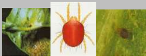
Ragno Rosso ( Panonychus citri )