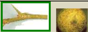
( Aonidiella aurantii )

Chi non è riuscito a fare il trattamento contro la 1° e 2° generazione o comunque nelle aree dove le elevate temperature hanno favorito lo sviluppo di una 3° generazione, può ancora intervenire con un specifico trattamento.