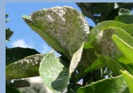
Aleirode fioccoso degli agrumi ( Aleurothrixus floccosus )

A superamento delle soglie di intervento.