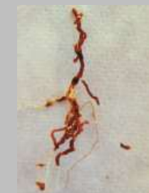
Radichette marce, prive di tratti del mantello corticale