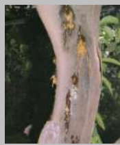
Flussi gommosi su vecchio tronco di limone