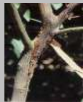
Marciume da Phytophthora sul nesso di giovane piantina in vivaio, fuoriuscita di flussi gommosi in prossimità del colletto e lesioni delimitate da cerchi cicatriziali e spaccature sul fusto